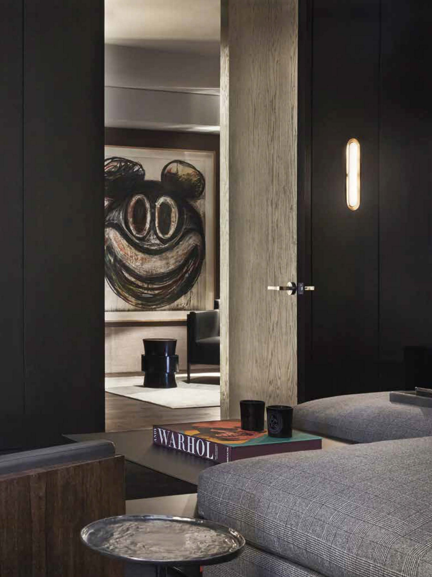
De tekening van Mickey is van kunstenaar Joyce Pensato. Rechts het kunstwerk We are coming out van Laure Prouvost, via Lisson Gallery.