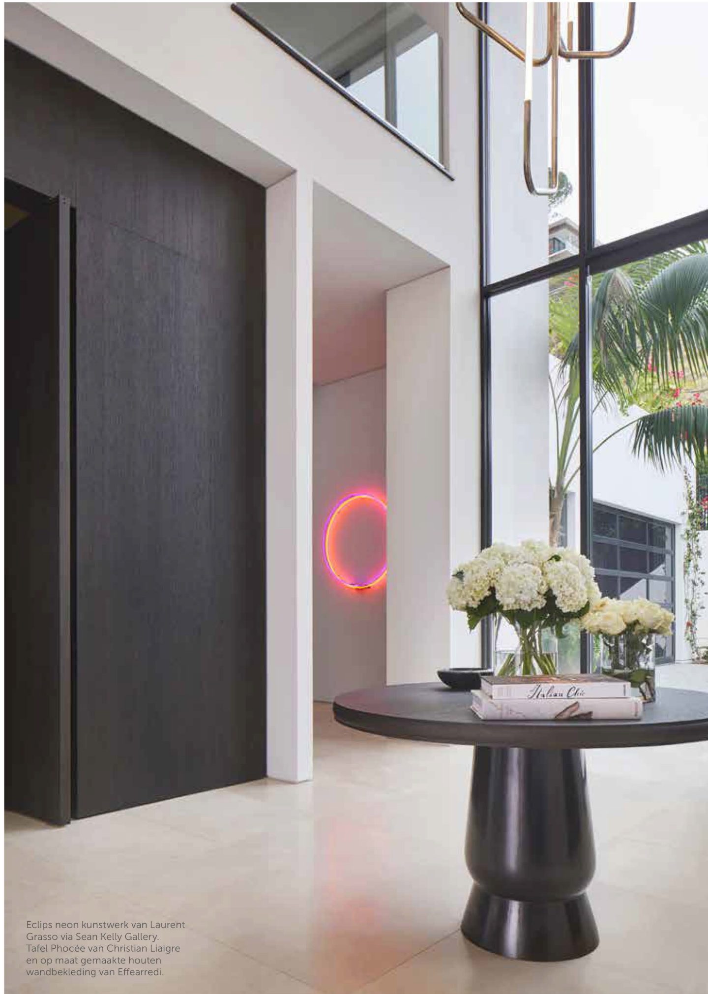
Eclips neon kunstwerk van Laurent Grasso via Sean Kelly Gallery. Tafel Phocéé van Christian Liaigre en op maat gemaakte houten wandbekleding van Effearedi.